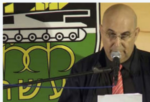
כנס גדוד 9 – ארבעים שנה למלחמה