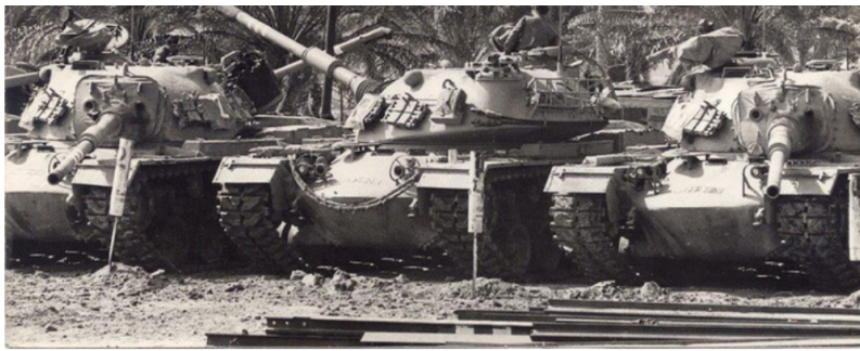
טנקי הגדוד בנווה המדבר קטיה לפני המלחמה