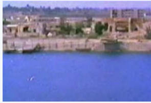
דו"ח גד' 196/79 שנכתב ע"י מג"ד 79 - נתן בן ארי מיד לאחר מלחמת יום הכיפורים