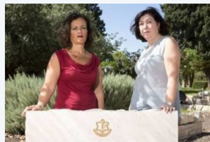
אחרי 42 שנה, דו"ח פנימי חושף: גופות צוות טנק שנעדר בסיני הוחזרו לישראל ב-77 והמשפחות לא ידעו