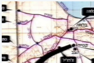
רקע על גדוד 9 – כנס לוחמים 2003