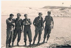
גדוד 184 - הצילומים של רמי הלפרין ז"ל