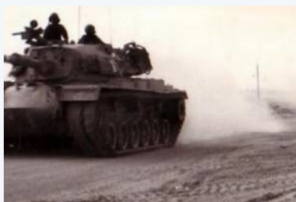
רשת הקשר "דליה" - גדוד 52 ב- 7.10.73