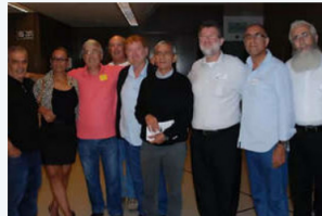
כנס גדוד 52 - ארבעים שנה למלחמה